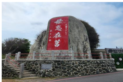
篤行十村眷村文化保存園區